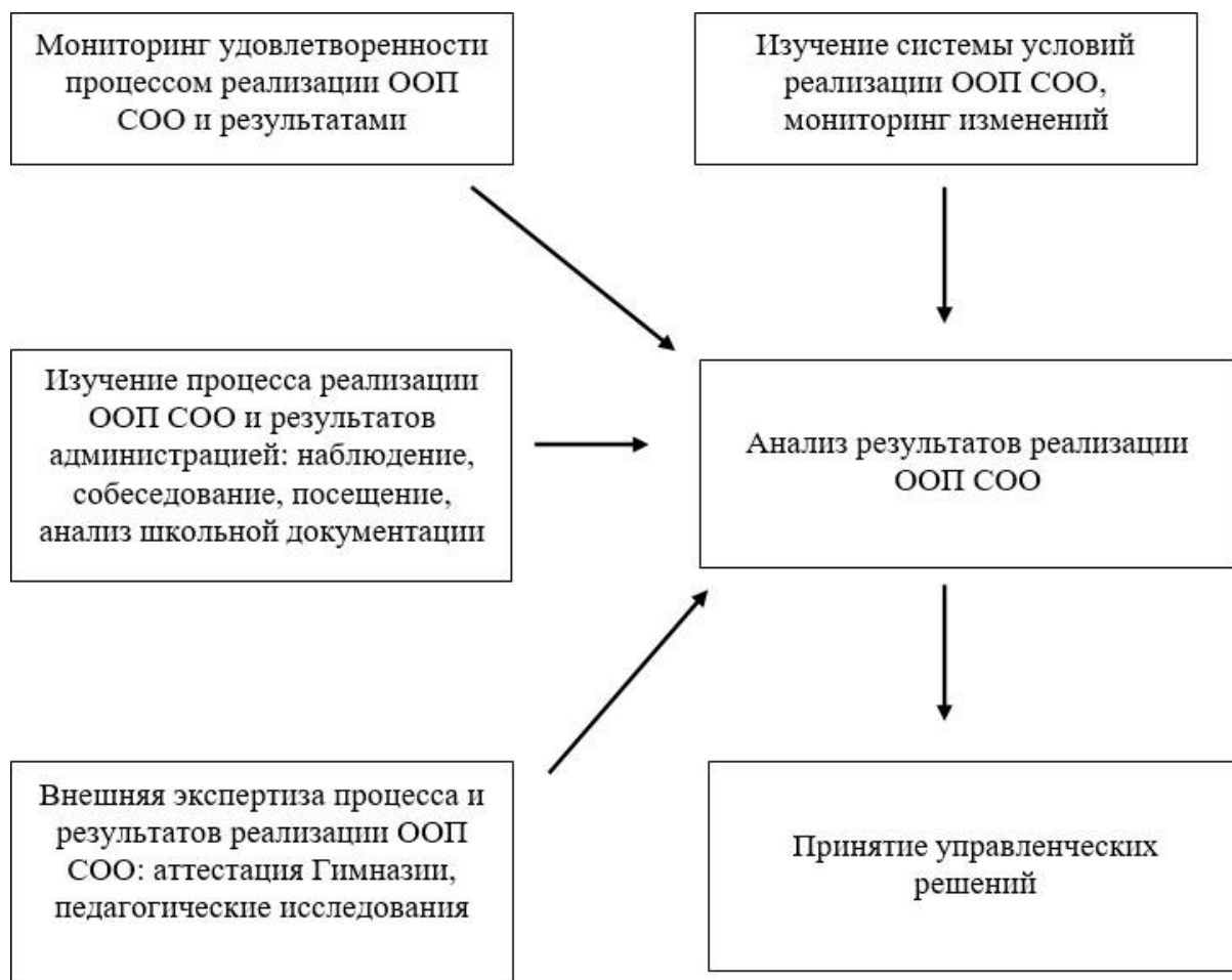
Схема. 1. Механизм принятия управленческих решений