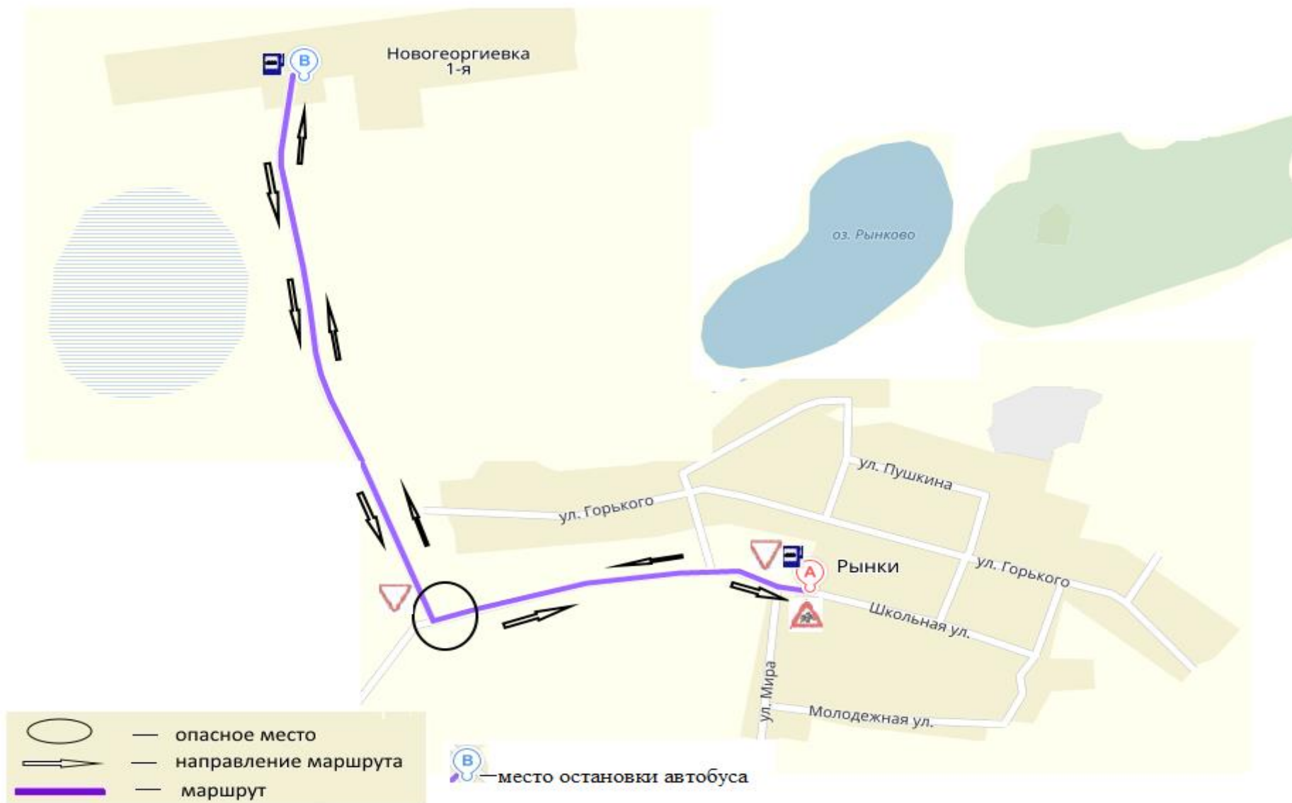
Схема движения автобуса ПАЗ-320570 У768 МУ 45 по маршруту с. Рынки – д. Новогеоргиевка-1